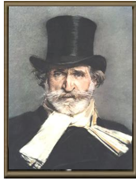
ジュゼッペ・ヴェルディ Giuseppe Verdi (1813 年～1901 年)

ジュゼッペ・ヴェルディは北イタリアのレ・ロンコーレという村に生まれたイタリア・オペラにおける最大のロマン派の作曲家のひとりです。ヴェルディが作曲したオペラは 26 作品あり、有名なものとしては『マクベス』(34 歳)、『リゴレット』(38 歳)、『椿姫』(40 歳)、『アイーダ』(58 歳)、『オテロ』(74 歳)、『ファルスタッフ』(84 歳)等があります。またカトリックのミサ曲として、モーツァルトやフォーレとともに「三大レクイエム」の一つに数えられる作品があります。イタリア・オペラに変革をもたらしたヴェルディは功績からイタリア紙幣にも肖像が採用されています。