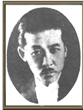
山田 耕筈 (1886 年～1965 年)

詩人北原白秋との共同で「ペチカ」「待ちぼうけ」「からたちの花」「この道」「砂山」、三木露風の作詞で「赤とんぼ」等、数多くの名作を残しています。また、全国高等学校野球選手権大会の入場行進曲の作曲者としても有名です。